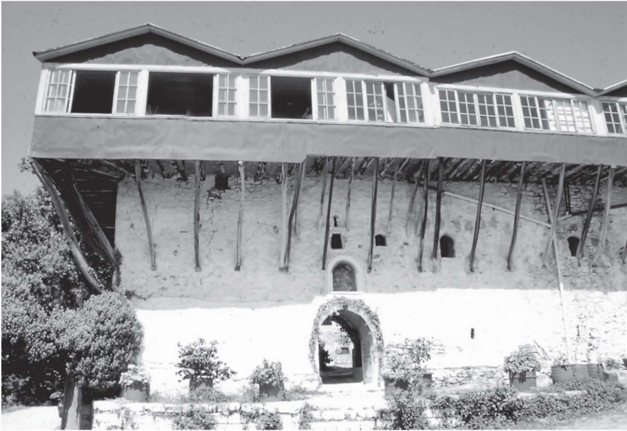
Μονή Αγίου Γεωργίου Φενεοῦ Ὁψη ἀπό τά νοτιοδυτικά.